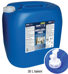
30 L balení obsahuje kulový vypustní ventil