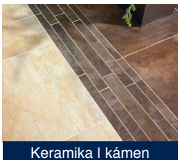
Keramik a kámen