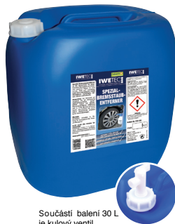
Součástí balení 30 L je kulový ventil