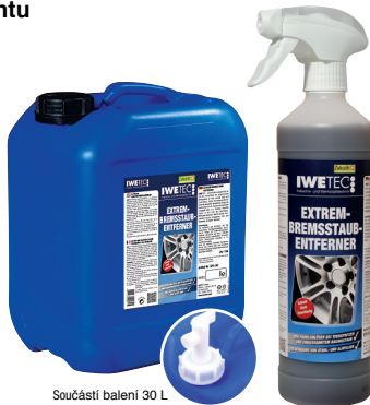
Součástí balení 30 L je kulový ventil