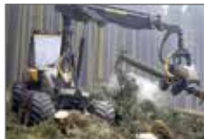
Harvestery, čelní a teleskopické nakladače