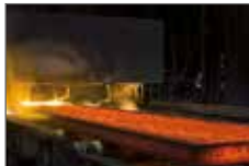
Valivá ložiska v hutním průmyslu

ADD PLUS Antioxidanty a korozní přísady poskytují velmi dobrou ochranu proti korozi a oxidaci proti vodě a slané vodě. Příkladně zajišťují vlastnosti nouzového chodu, takže na ložisku vždy zůstává zbytkový mazací film.