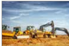
Povrchová těžba pro použití v bagrech, kolových nakladačích, kloubových a sklápečích vazech, dopravních pásích