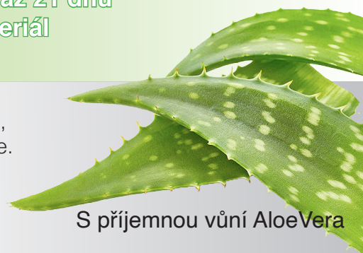
S příjemnou vůní AloeVera