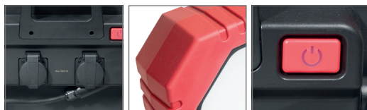
Se 2 zásuvkami