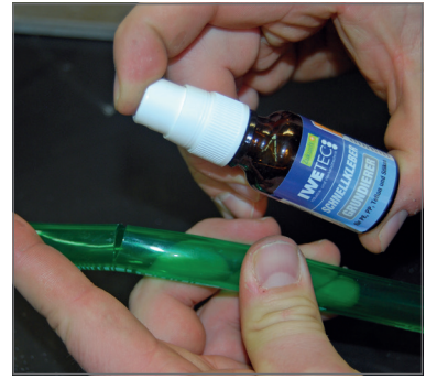
Grundierer aufsprühen und sofort mit dem Kleben beginnen.