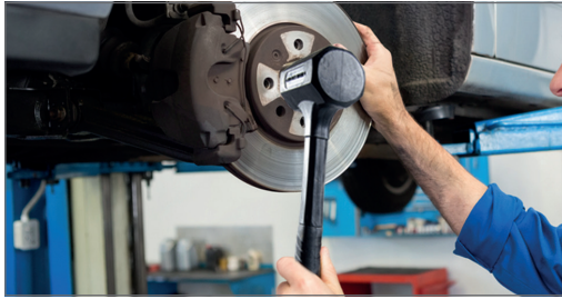
Pro montáž a demontáž v automobilovém průmyslu