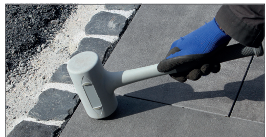
Nezanechává nežádoucí barevné stopy ...