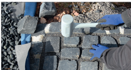
Pro pokládku dlažebních materiálů ...