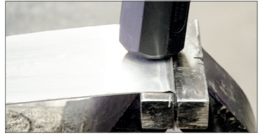
Pro ohýbání plechů a kovových obrobků