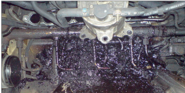
Řeší problémů s vypálenými a zuhelnatělými vstříkovači nafty.