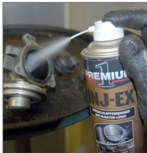
INJ-EX důkladně čistí ventily EGR a volnoběžné ventily.